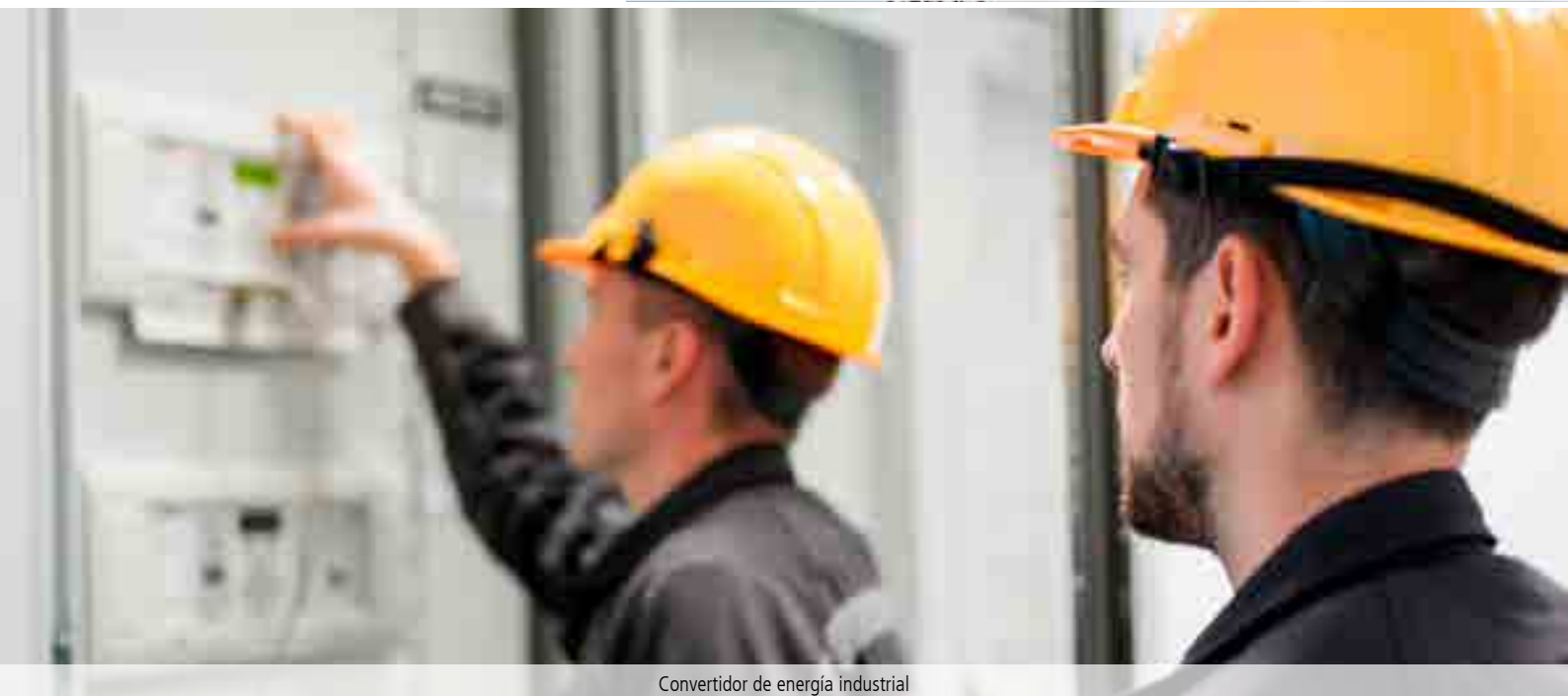
Convertidor de energía industrial