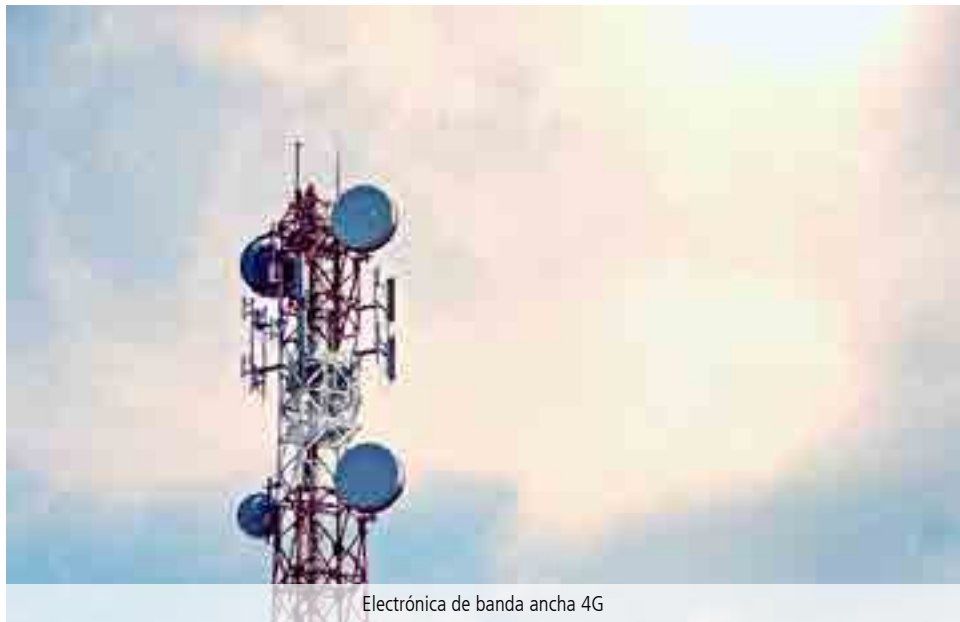
Electrónica de banda ancha 4G