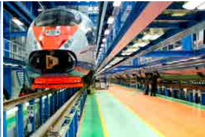
Accionamientos de tracción IGBT de alta potencia