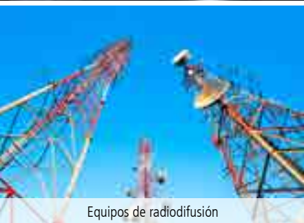
Equipos de radiodifusión