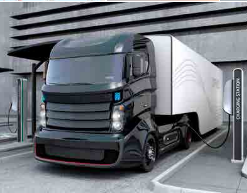
Control de temperatura estaciones de carga EV