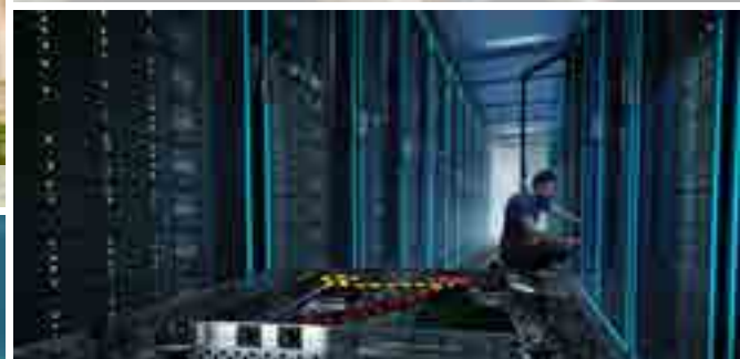
Servidor de datos con refrigeración líquida directa