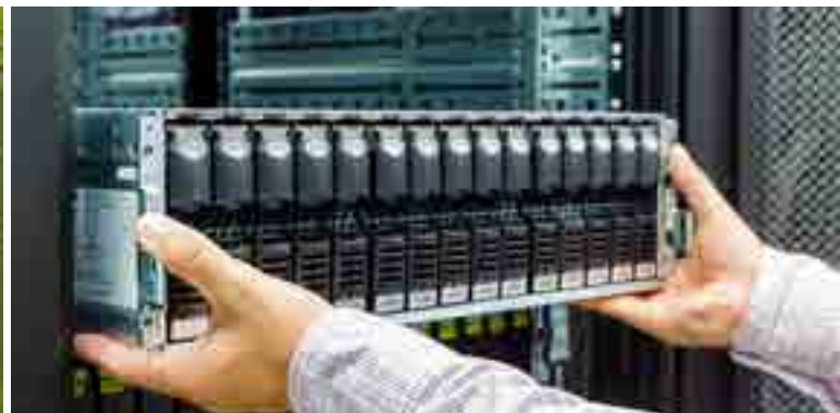
Enfriamiento de los componentes electrónicos montados en bastidor utilizando acoplamientos ciegos