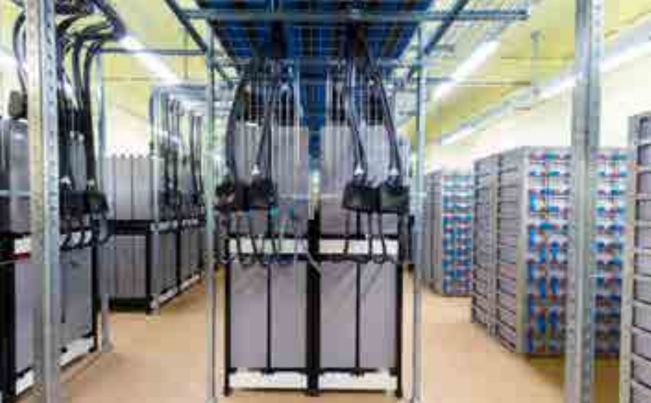
Paquetes de baterías de ion-litio