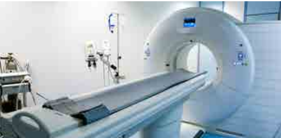
Equipos electrónicos de imágenes médicas

CEJN se reserva el derecho de hacer cambios sin previo aviso. Consulte disponibilidad y precios con un distribuidor autorizado de CEJN. Medidas en mm. Roscas especificadas según norma ISO. Otras conexiones y juntas bajo pedido. Consulte nuestra página web www.cejn.es sobre consejos de mantenimiento.