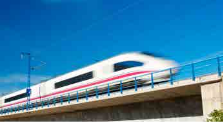
Refrigeración convertidores de tracción