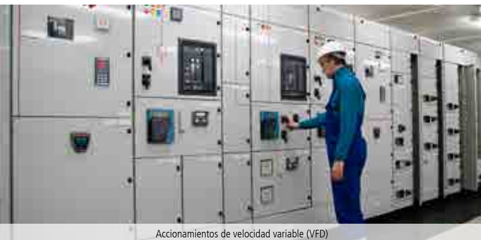
Accionamientos de velocidad variable (VFD)

CEJN se reserva el derecho de hacer cambios sin previo aviso. Consulte disponibilidad y precios con un distribuidor autorizado de CEJN Medidas en mm. Roscas especificadas según norma ISO. Otras conexiones y juntas bajo pedido. Consulte nuestra página web www.cejn.es sobre consejos de mantenimiento.