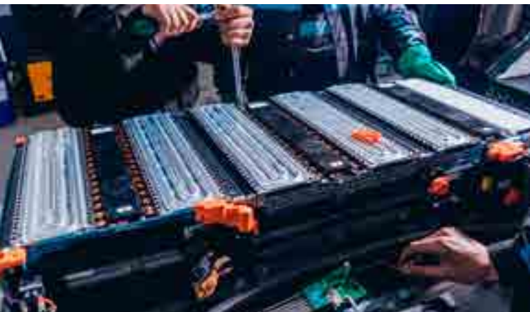
Placa de refrigeración líquida EV