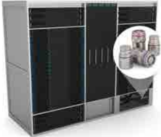
Servidor de datos HPC - Unidad de distribución central (CDU)