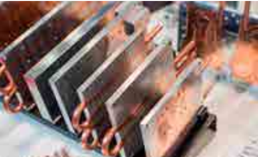
Placas refrigeración líquida