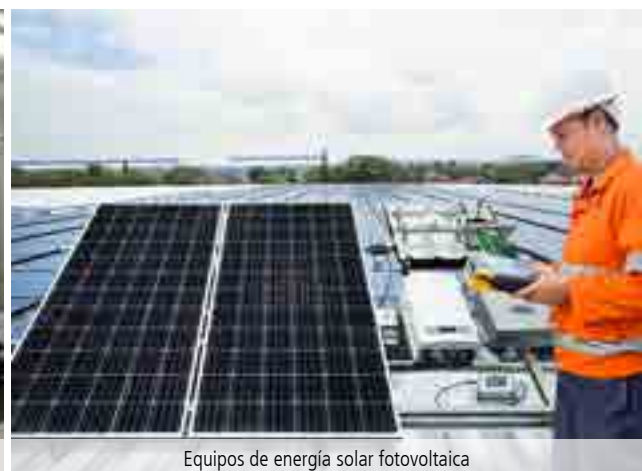
Equipos de energía solar fotovoltaica