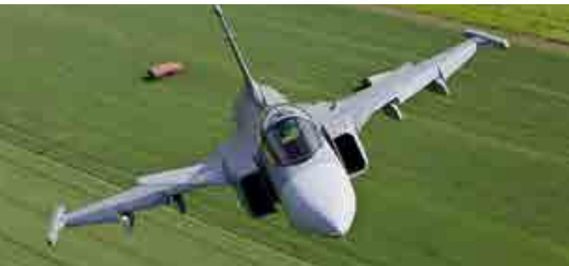
Aviónica- Radar de enfriamiento

CEJN se reserva el derecho de hacer cambios sin previo aviso. Consulte disponibilidad y precios con un distribuidor autorizado de CEJN. Medidas en mm. Roscas especificadas según norma ISO. Otras conexiones y juntas bajo pedido. Consulte nuestra página web www.cejn.es sobre consejos de mantenimiento.