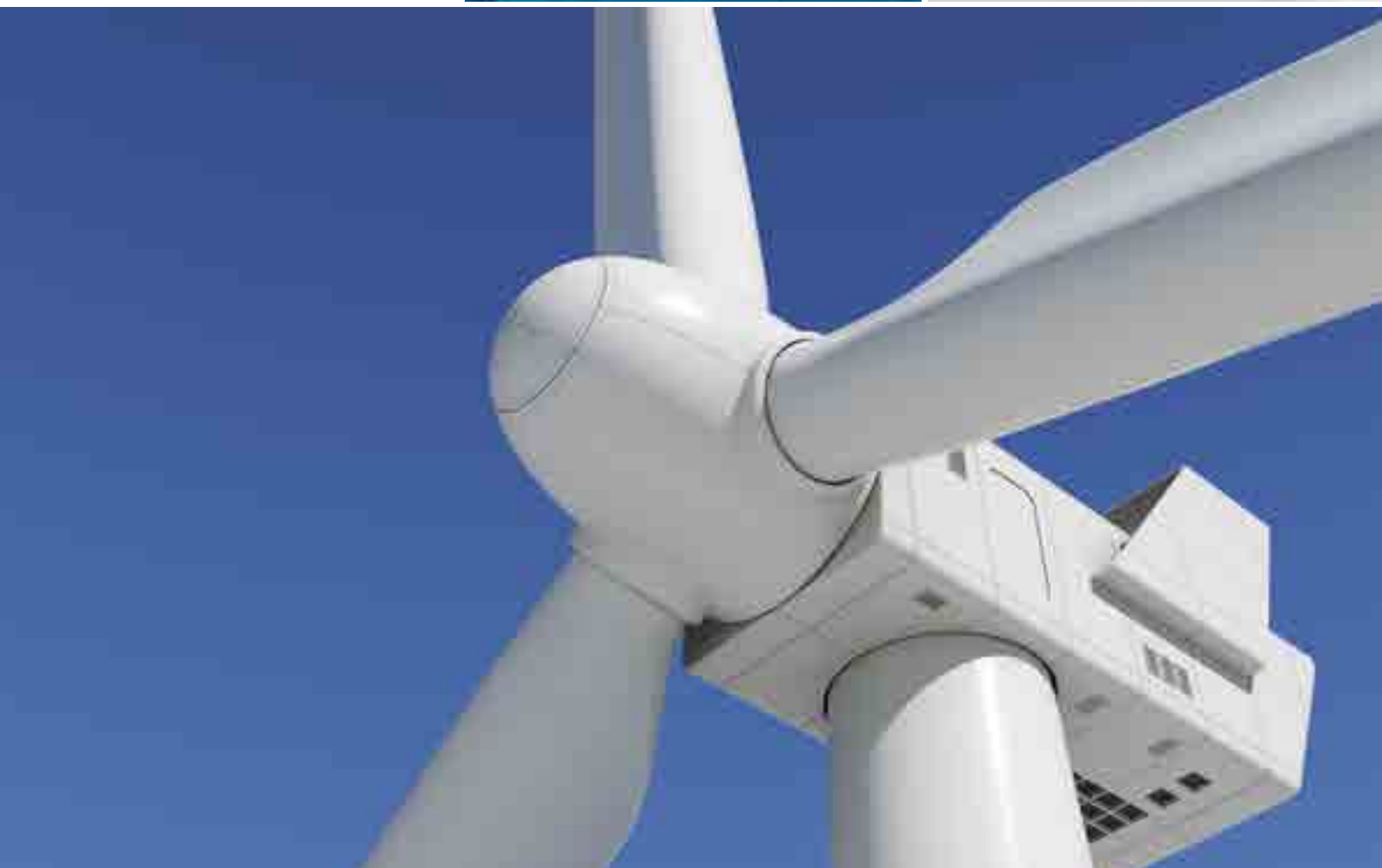
Convertidor turbina eólica AC/AC