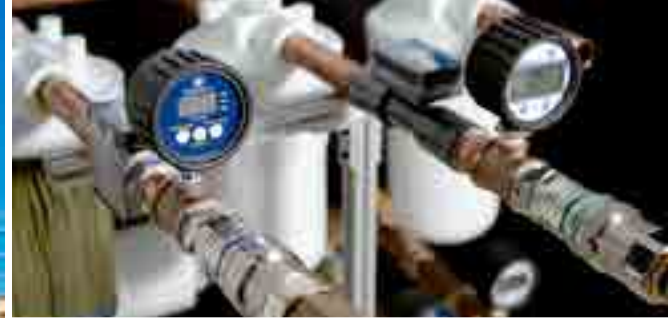
Servidores de datos de computación de alto rendimiento (HPC) con refrigeración líquida