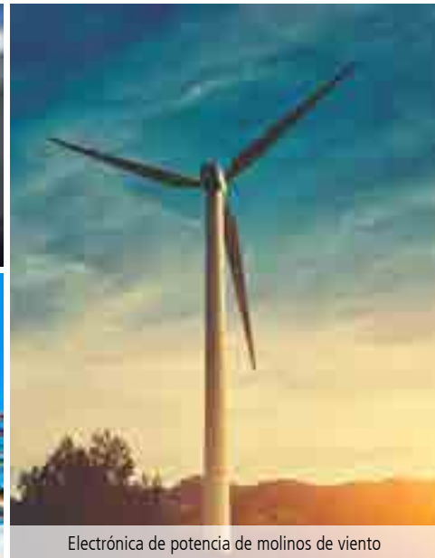
Electrónica de potencia de molinos de viento