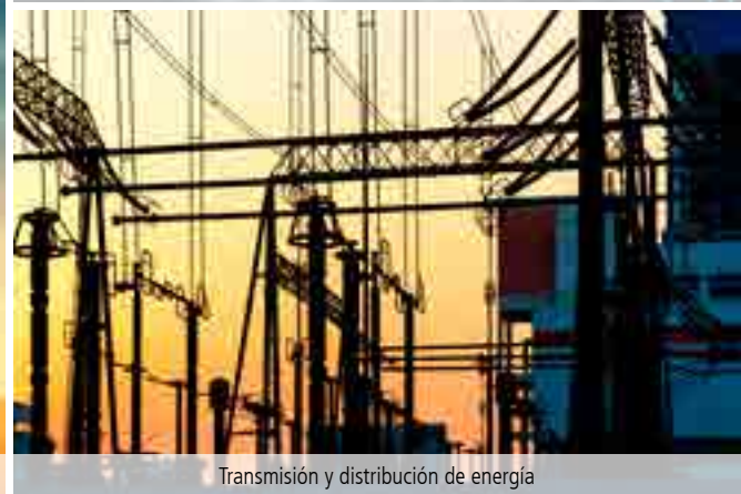
Transmisión y distribución de energía