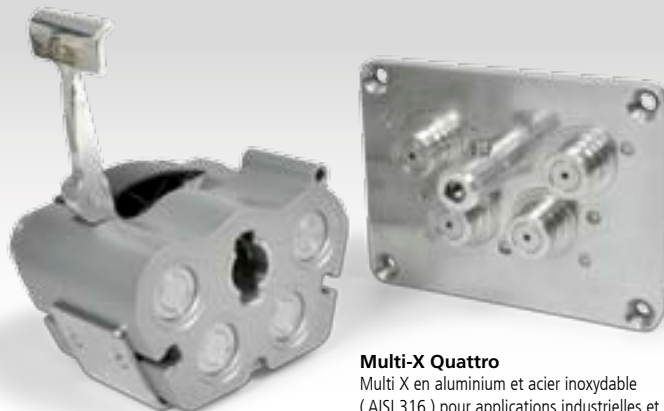
Multi-X Quattro Multi X en aluminium et acier inoxydable ( AISI 316 ) pour applications industrielles et offshore.