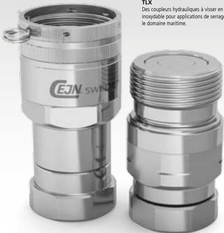
TLX Des coupleurs hydrauliques à visser en acier inoxydable pour applications de serrage dans le domaine maritime.