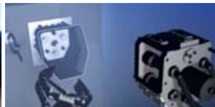
YouTube Raccordement CEJN sur ROV