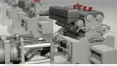
YouTube Auto-coupleurs sur banc moteurs