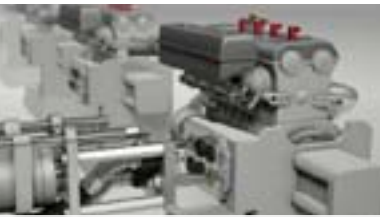
YouTube Pruebas de motor con auto conexiones