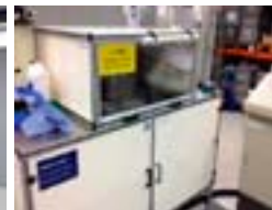
Mesa de pruebas para presión con capacidad hasta 4000 bar