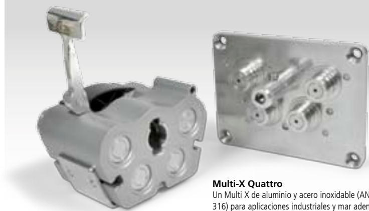
Multi-X Quattro Un Multi X de aluminio y acero inoxidable (ANSI 316) para aplicaciones industriales y mar adentro.