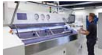
Mesas de prueba de flujo para aceite hidráulico y agua, con capacidad de hasta 300 litros por minute.