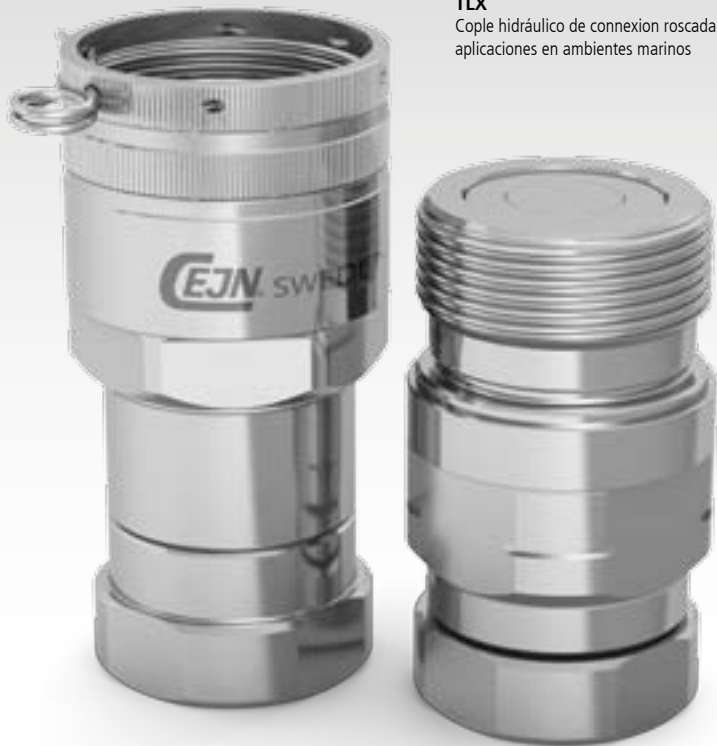
TLX Cople hidráulico de conexión roscada para aplicaciones en ambientes marinos