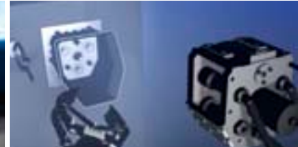
YouTube Conexión ROV para mar adentro de CEJN